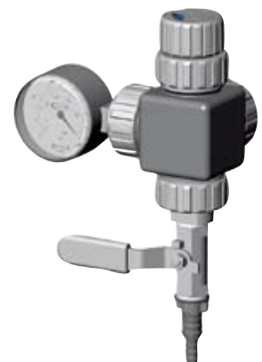
VCL RKM A1