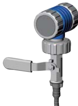
VCL K A1