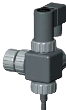
VCL 11 A1