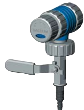
VCL 02 A1