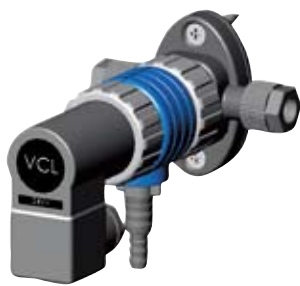
VCL 10 A1